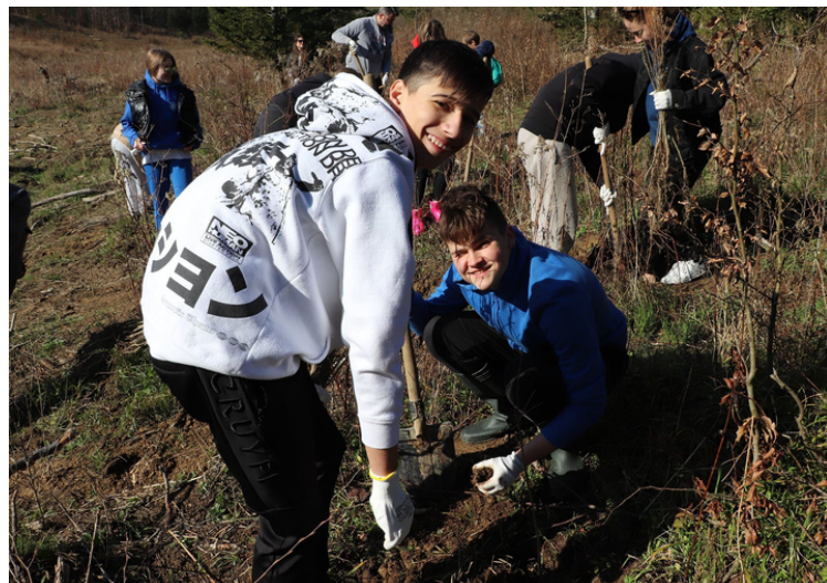
prirodu i okoliš