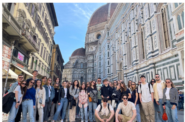
učenje i putovanje