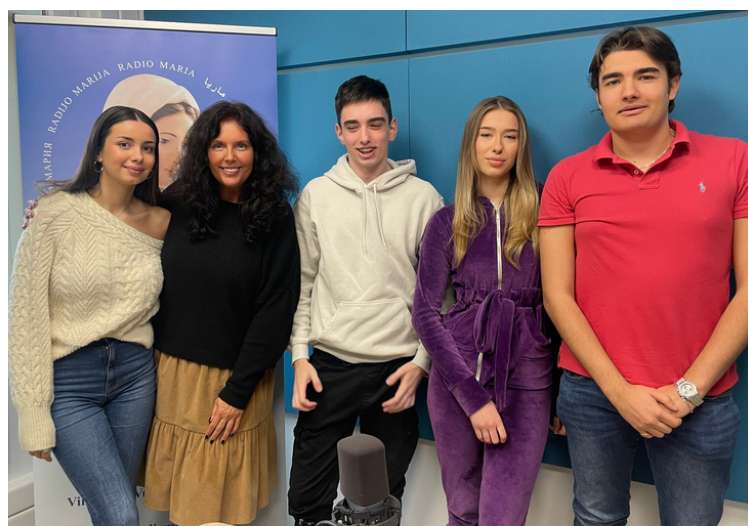
rad u medijima