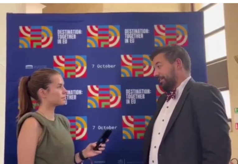
vrijednosti Europske unije