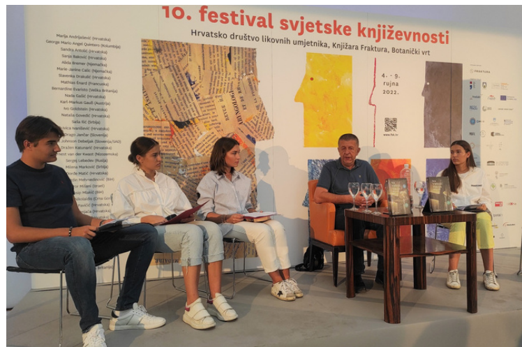
baštinu i kulturu