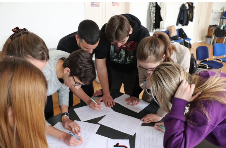
otkrivanje i istraživanje